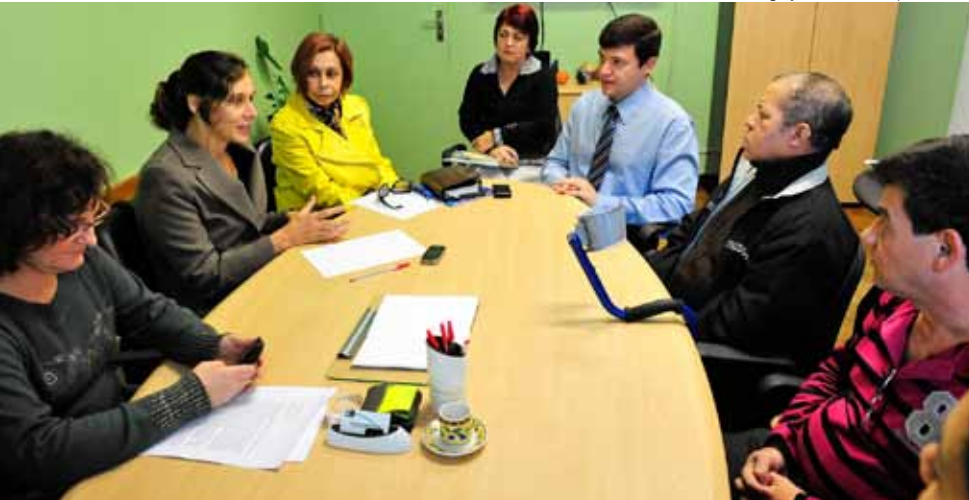
Reunião de trabalho do Grupo Técnico.