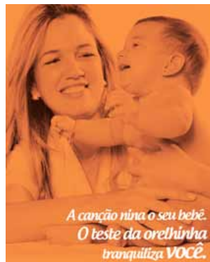
Fôlder da campanha do CREFONO 8.

Além das estratégias de divulgação por meio de palestras e encontros, um excelente material gráfico será distribuído. Fôlderes explicativos sobre o Teste da Orelhinha deverão ser entregues nos locais de realização dos eventos, nas unidades de saúde e nas universidades e faculdades.