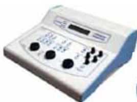
Imitanciômetro AO-400R de fabricação própria com Registro na ANVISA n° 80100810005