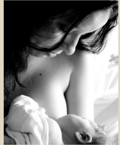
Campanha Saúde: o Seio da Questão reforçou a importância da amamentação.

Em Alagoas, Bahia, Paraíba, Pernambuco e Sergipe, estados que constituem o CREFONO 4, foram promovidas palestras e orientações para mães. O mesmo ocorreu em Porto Alegre (RS), que teve ainda a instala-