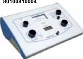
Audiômetro AO-250D de fabricação própria com Registro na ANVISA n° 80100810004

ACÚSTICA ORLANDI IND. COM. E SERV. AUDIOLÓGICOS LTDA.