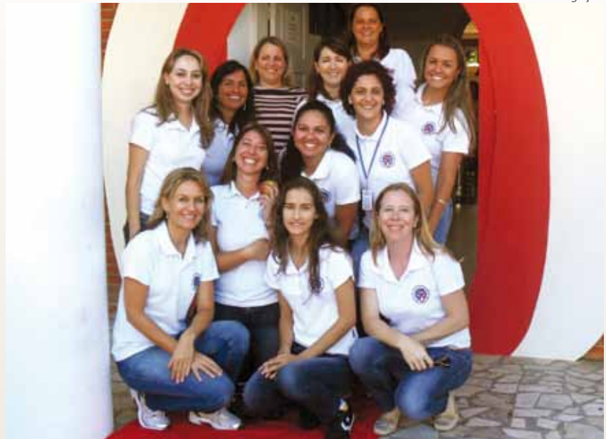
Fonoaudiólogas catarinenses desenvolvem ações de avaliação, orientações aos pais e campanhas na comunidade.

Avaliações fonoaudiológicas e encaminhamentos – com o objetivo de possibilitar descobertas que facilitem a intervenção precoce em alterações que possam interferir no processo ensino-aprendizagem e/ou que necessitem de encaminhamentos para intervenção clínica, ou, ainda, encaminhamentos a exames complementares para auxiliar a melhor conduta ante a equipe da instituição educacional e o educando.